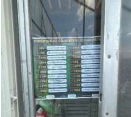
รูปที่ 11 เบอร์ดอร์ลูกเงิน