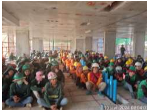
รูปที่ 29 Morning Talk