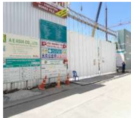
รูปที่ 36 ประตูทางเข้า-ออก