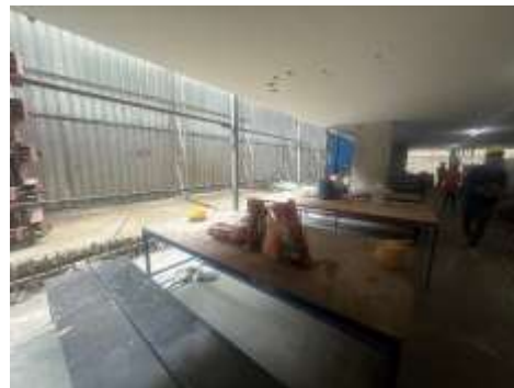
รูปที่ 10 ที่พักสำหรับคนงาน