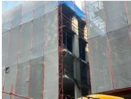
รูปที่ 38 สภาพหน้างานปัจจุบัน