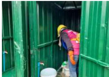
รูปที่ 51 คนงานทำความสะอาดห้องน้ำ