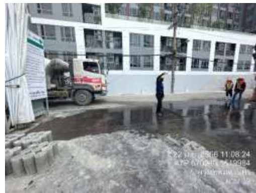
รูปที่ 25 เจ้าหน้าที่รักษาความปลอดภัย