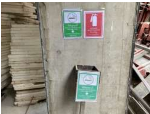
รูปที่ 18 ป้ายห้ามสูบบุหรี่