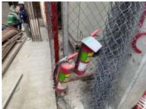
รูปที่ 9 ตรวจเช็คถังดับเพลิง