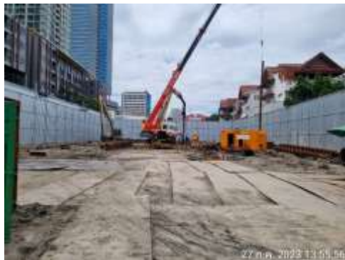
รูปที่ 20 ปูแผ่นเหล็ก