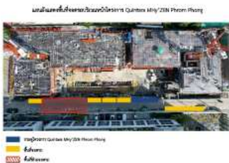
รูปที่ 44 พื้นที่จอดรถ