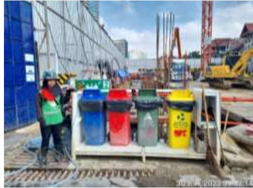
รูปที่ 47 ถังขยะ