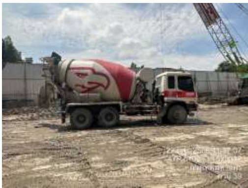
รูปที่ 24 รถปูนสำเร็จรูป