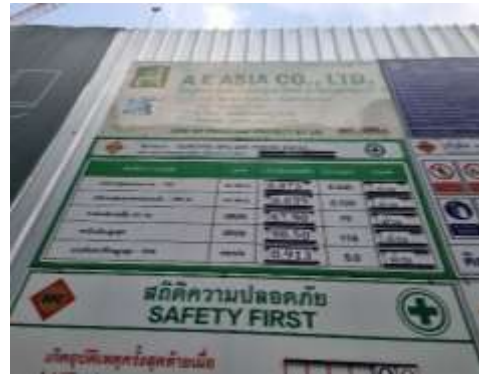
รูปที่ 17 ป้ายแสดงผลการตรวจวัด