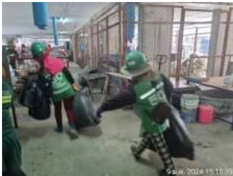
รูปที่ 48 คนงานทำความสะอาดถังขยะ