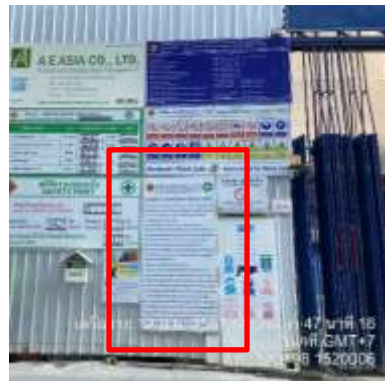
รูปที่ 3 กฏระเบียบการก่อสร้าง