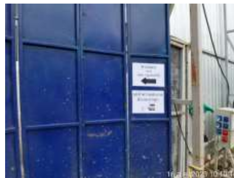
รูปที่ 43 ป้ายแสดงลูกศรเข้า-ออก