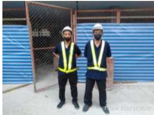
รูปที่ 42 เจ้าหน้าที่รักษาความปลอดภัย