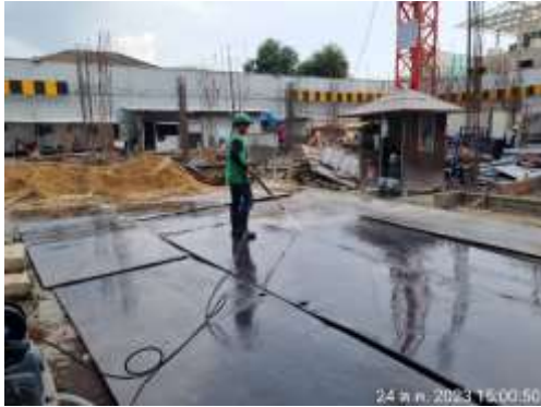
รูปที่ 22 พื้นที่ล้างล้อรถ