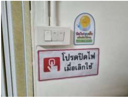
รูปที่ 16 ป้ายประหยัดน้ำ/ประหยัดไฟ