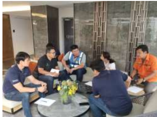
รูปที่ 1 เจ้าหน้าที่โครงการเข้าพบบ้านพักอาศัยข้างเคียง