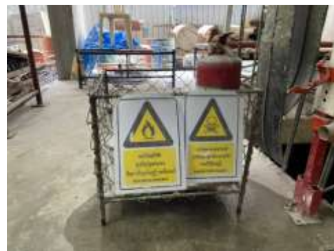
รูปที่ 33 ถังดับเพลิงบริเวณพื้นที่ที่มีการใช้แก๊ส