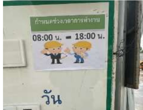
รูปที่ 12 ป้ายกำหนดเวลาในการทำงาน