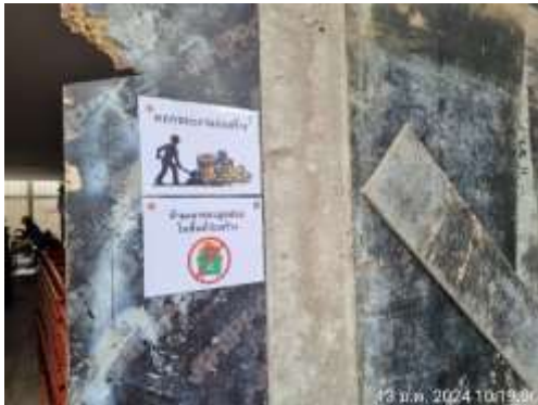
รูปที่ 28 ป้ายห้ามเผาขยะ