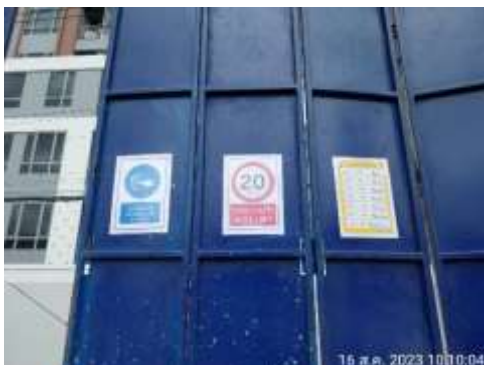
รูปที่ 14 ป้ายจำกัดความเร็ว