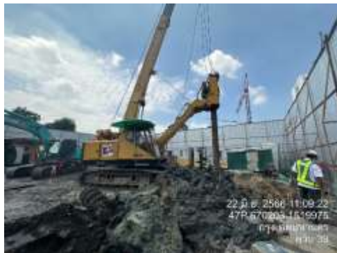
รูปที่ 26 เจาะเสาเข็ม