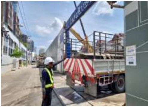
รูปที่ 41 เจ้าหน้าที่อำนวยความสะดวกบริเวณ ทางเข้า-ออก