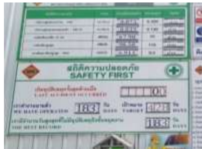
รูปที่ 37 ป้ายสถิติความปลอดภัย