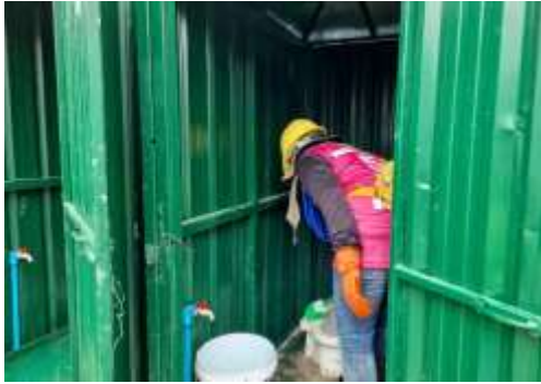
รูปที่ 46 คนงานทำความสะอาด