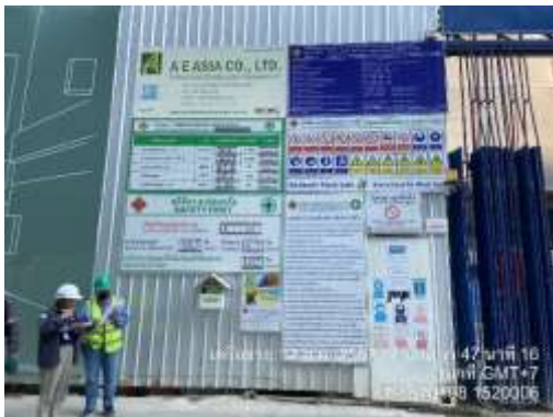
รูปที่ 2 ป้ายรายละเอียดโครงการ