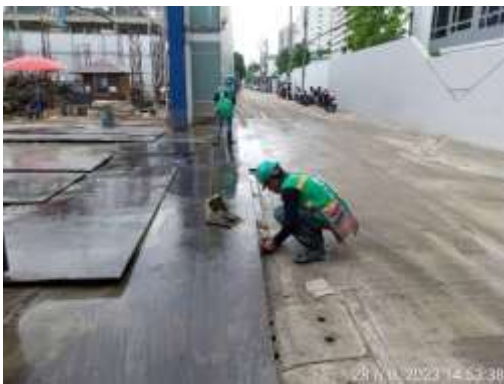
รูปที่ 35 คนงานทำความสะอาดบริเวณด้านหน้าโครงการ