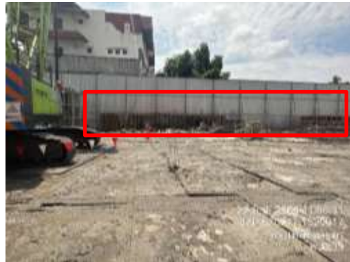
รูปที่ 6 กำแพงกันดิน