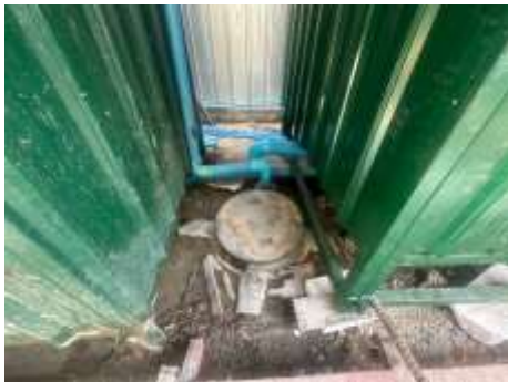
รูปที่ 50 ถังบำบัดน้ำเสีย