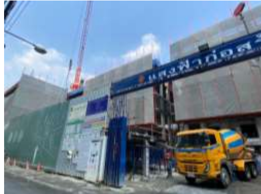
รูปที่ 23 ล้างล้อรถ