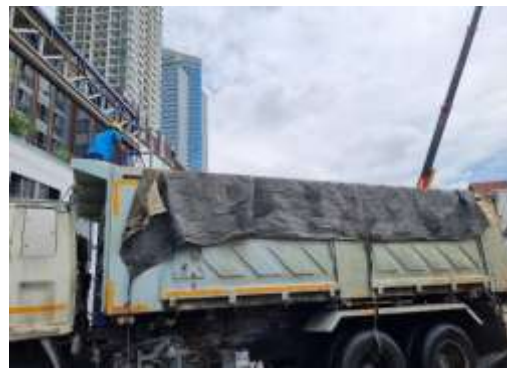
รูปที่ 19 ปิดคลุมท้ายรถบรรทุก