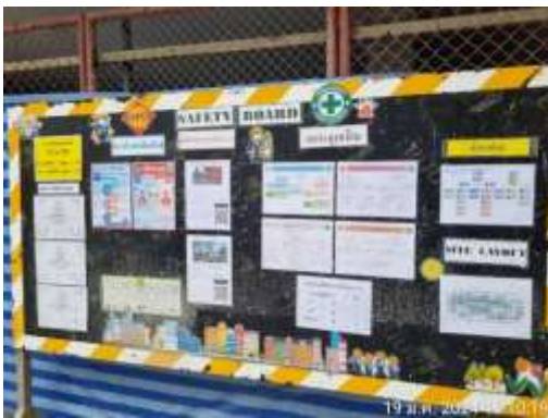
รูปที่ 13 ป้ายประชาสัมพันธ์เกี่ยวกับโรค Covid-19