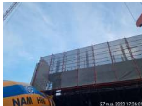
รูปที่ 40 ติดตั้งผ้าใบก่อสร้างMesh sheet