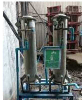
รูปที่ 45 น้ำดื่มสะอาด