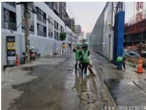
รูปที่ 30 คนงานฉีดพรมน้ำ