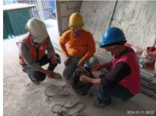
รูปที่ 34 ตรวจสอบสภาพอุปกรณ์