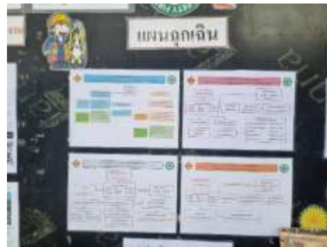
รูปที่ 20 แผนฉุกเฉิน