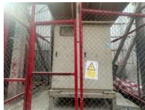
รูปที่ 15 ป้ายเตือนอันตรายไฟฟ้าแรงสูง