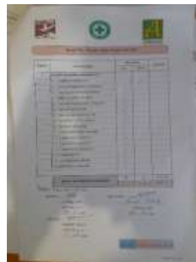
รูปที่ 31 เอกสารตรวจสอบความปลอดภัย