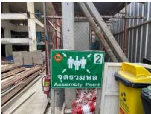
รูปที่ 7 ป้ายจุดรวมพล