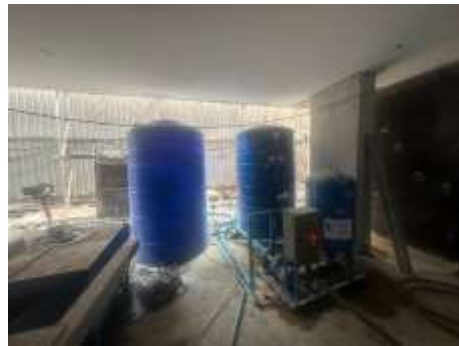
รูปที่ 49 ถังสำรองน้ำ