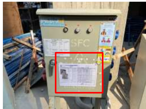
รูปที่ 8 ตรวจเช็คตู้ไฟ