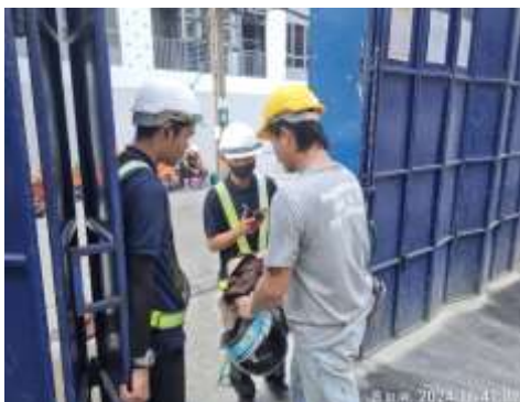
รูปที่ 32 ตรวจสอบสารเสพติดคนงาน