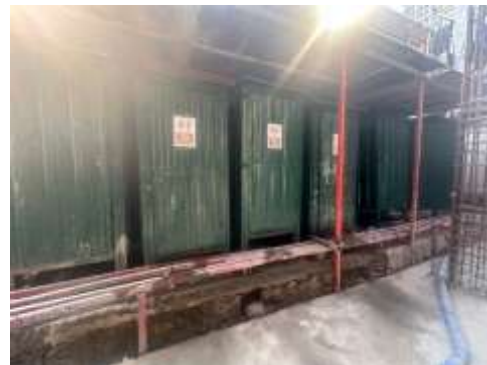
รูปที่ 27 ห้องน้ำคนงาน