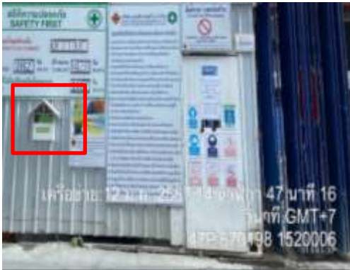
รูปที่ 5 กล่องรับเครื่องร่อนเรียน