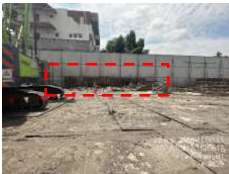
รูปที่ 39 Sheet Pile